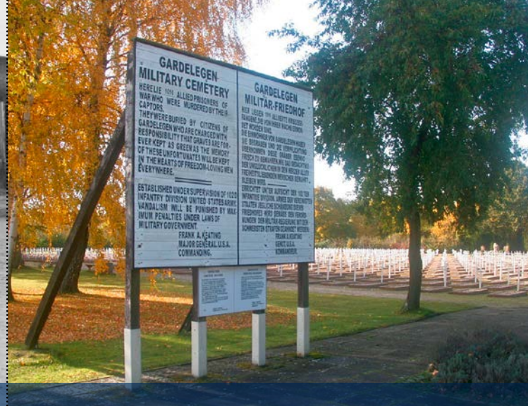
Alliierte Hinweistafel auf dem Ehrenfriedhof vom April 1945, originalgetreue Nachbildung.

In Gardelegen brachten die SS-Männer die KZ-Häftlinge zunächst in der Remonteschule – einer alten Kavalleriekaserne – unter. Am Abend des 13. April 1945 zwangen sie sie auf einen Fußmarsch an den Stadtrand zur dort gelegenen Feldscheune des Gutes Isenschribbe. Unter Beteiligung von Angehörigen der Wehrmacht, des Reichsarbeitsdienstes, des Volkssturms und weiterer NS-Organisationen trieben sie die