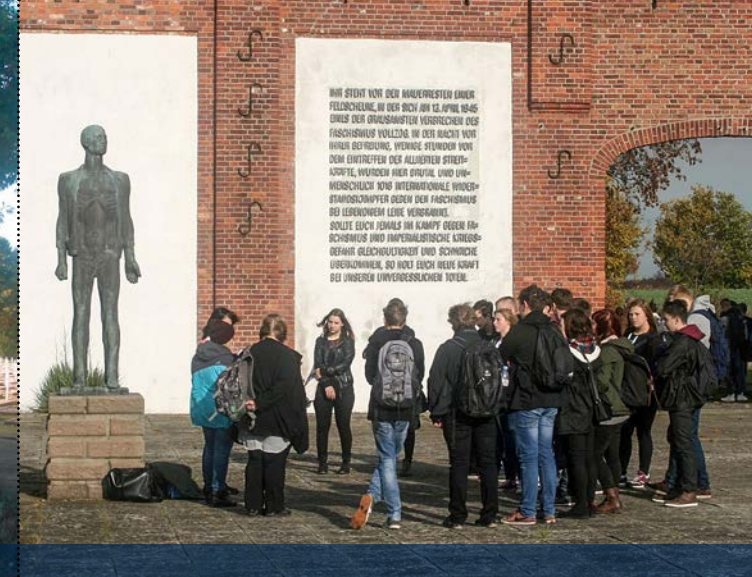
Schulklassen aus Gardelegen bei einem Projekttag in der Gedenkstätte.

Am folgenden Tag erreichten US-Truppen Gardelegen. Sie verhinderten den Versuch der Täter, der städtischen Feuerwehr und des Technischen Notdienstes, die Spuren des Massenmordes zu beseitigen. Diese hatten bereits mit dem Ausheben von Gräben begonnen, um die Ermordeten ohne Kennzeichnung zu verscharren. General Frank A. Keating, Oberbefehlshaber der 102. US-Infanterie-Division, ordnete eine Exhumierung durch die Bevölkerung der Stadt an. Unweit der Scheune ließ er für die Opfer des Massakers einen Friedhof mit Einzelgräbern anlegen. Nur 305 der 1.016 Toten konnten identifiziert werden. Eine Hinweistafel erklärte das Gräberfeld zum militärischen Ehrenfriedhof. Sie verpflichtete die örtliche Bevölkerung, die Gräber dauerhaft zu pflegen und das Andenken an die Ermordeten zu wahren. Auf Schändungen der Ruhestätte drohte die alliierte Militärverwaltung Strafen an.