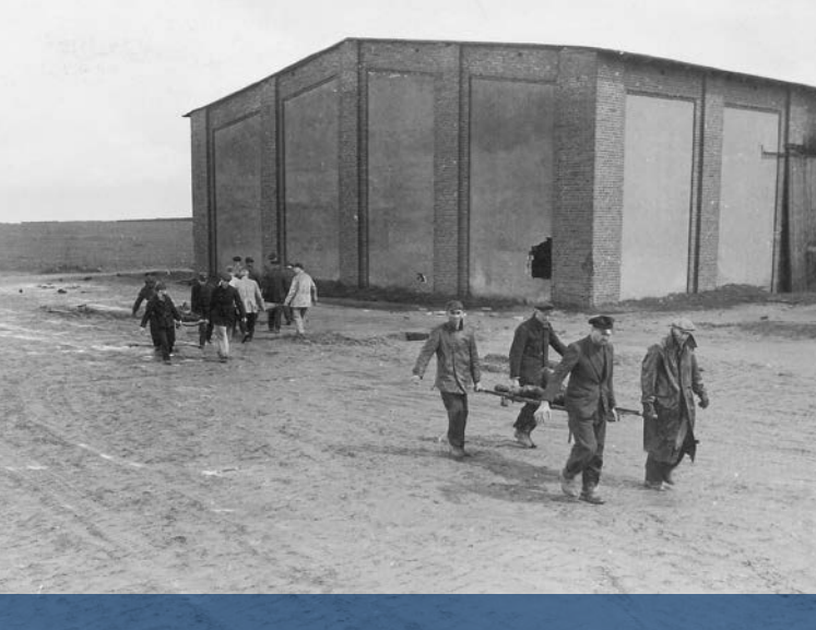
Nach dem Massaker, 22. April 1945: Auf Anordnung der US-amerikanischen Truppen tragen Bürger aus Gardelegen die Opfer aus der Scheune zur Bestattung auf den Ehrenfriedhof.

Die Gedenkstätte Feldscheune Isenschribbe Gardelegen erinnert an das Massaker vom 13. April 1945, bei dem 1.016 KZ-Häftlinge wenige Wochen vor Kriegsende in einer Scheune ermordet wurden.